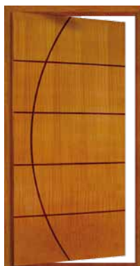
Porta Pivotante EG 381 P