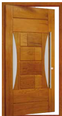
Porta Pivotante EG 550