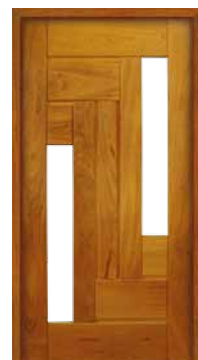
Porta Pivotante EG 558