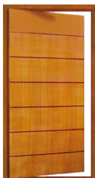
Porta Pivotante EG 383 P