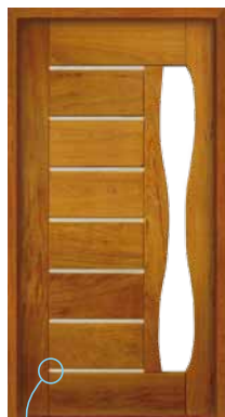
Porta Pivotante EG 552

O acabamento em aço escovado pode ser aplicado em todos os modelos.