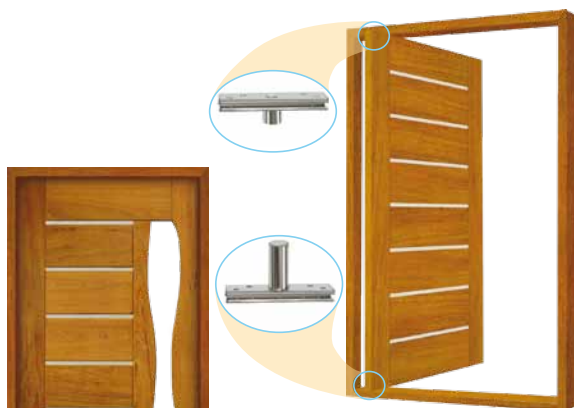
Porta Pivotante EG 551