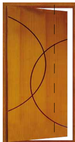
Porta Pivotante EG 386 P