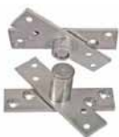
Kit Pivotante DEG 06

Sistema pivotante inferior e superior para porta (substitue dobradiça)