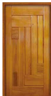
Porta Pivotante EG 556