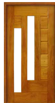
Porta Pivotante EG 559