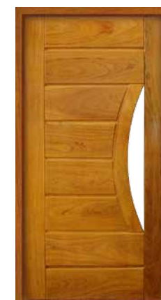
Porta Pivotante EG 554