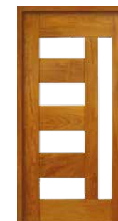
Porta Pivotante EG 562