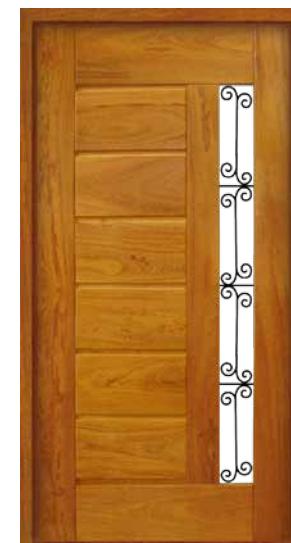
Porta Pivotante EG 560 A grade é opcional e pode ser instalada em todos os modelos

Kit Porta Pivotante: as ferragens são opcionais nesta linha de produtos