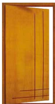
Porta Pivotante EG 385 P