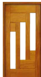
Porta Pivotante EG 561