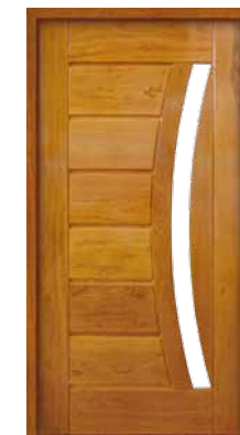
Porta Pivotante EG 555