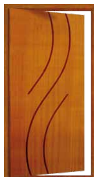
Porta Pivotante EG 384 P