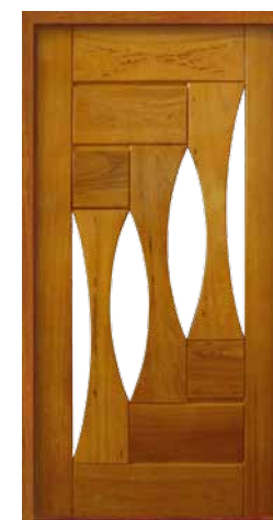
Porta Pivotante EG 553