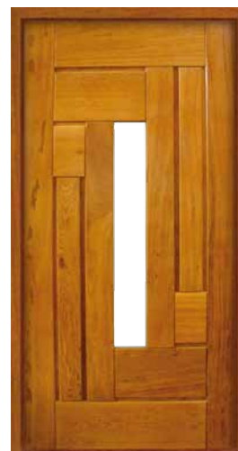
Porta Pivotante EG 557