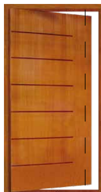
Porta Pivotante EG 382 P